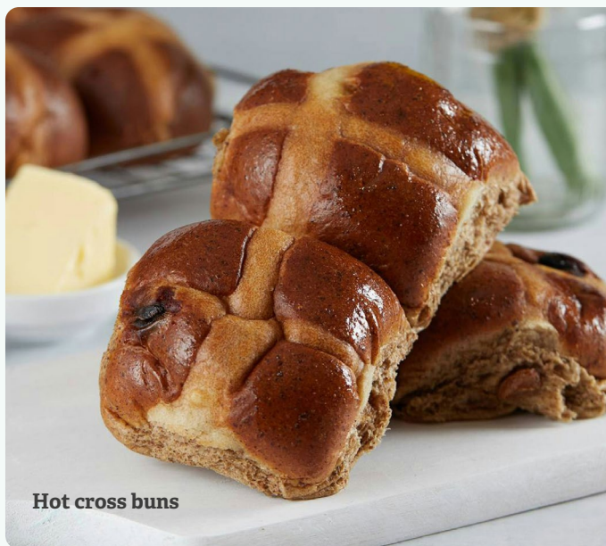
Hot cross buns

waarbij de melodieën het gewicht van de gelegenheid benadrukken. De boodschap van de voorganger is oprecht, en spoort de gemeente aan om zich de diepte van Christus' liefde te herinneren. Na de dienst vindt een dierbare traditie plaats: het uitdelen van de hot cross buns. De broodjes met een kruis erop, die zacht en geurend zijn, symboliseren de kruisiging en de hoop op opstanding. Gezinnen delen ze met elkaar, een eenvoudige maar betekenisvolle daad van gemeenschap en herinnering.