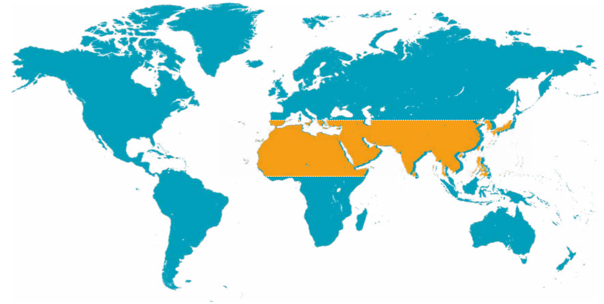
Figuur 1 • 10/40 window

3xM is de afkorting van More Message in the Media: het Evangelie van Jezus Christus via moderne media vertellen. Inspiratie voor deze missie vinden wij in de opdracht van Jezus Christus: “Ga dan heen, onderwijs al de volken, hen dopend in de Naam van de Vader en van de Zoon en van de Heilige Geest, hun lerend alles wat Ik u geboden heb, in acht te nemen.” Mattheüs 28:19